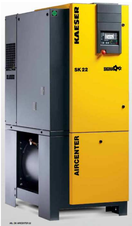
AB.: SK AIRCENTER 22