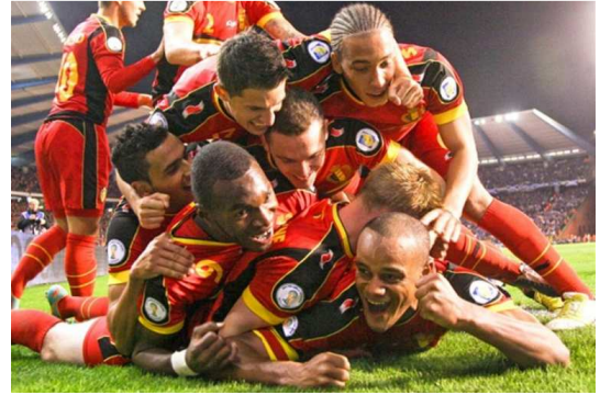
Made in Belgium

De autoliften worden ontworpen, geproduceerd en gemonteerd door PW equipment. In overleg met de architect of bouwheer kunnen we een plan opmaken van de lift en de liftschacht. Om de schachtoppervlakte optimaal te benutten maken we bij voorkeur gebruik van een schaarsysteem.