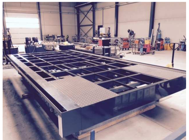
Productie, made in Belgium