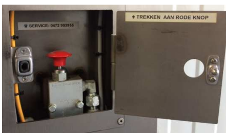
Zelfevacuatie met nooddaalventiel

U kan steeds contact opnemen met PW equipment voor een gedetailleerde offerte en uitvoeringsplan.