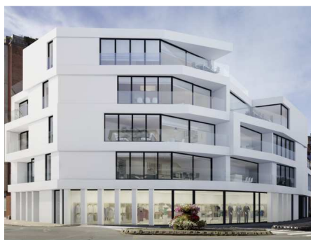
Appartementen en kantoren

Ook in de automotive worden autoliften ingezet. Een autolift in een showroom van een autodealer is niet alleen functioneel maar ook een eyecatcher.