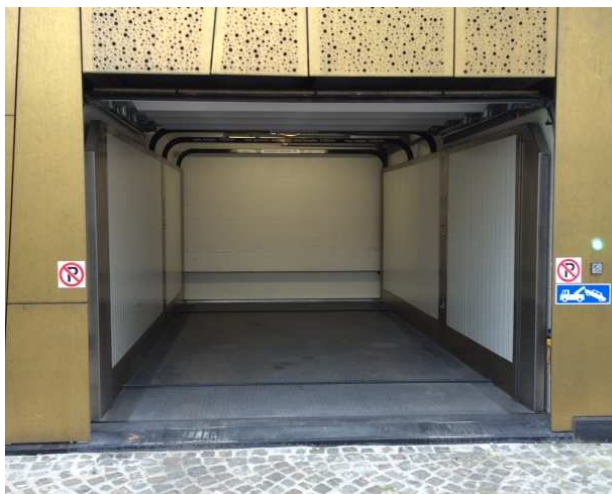
Groen licht: bestuurder rijdt binnen