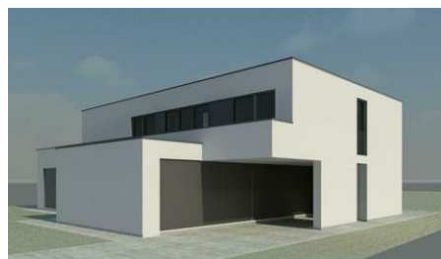
Des maisons particulières