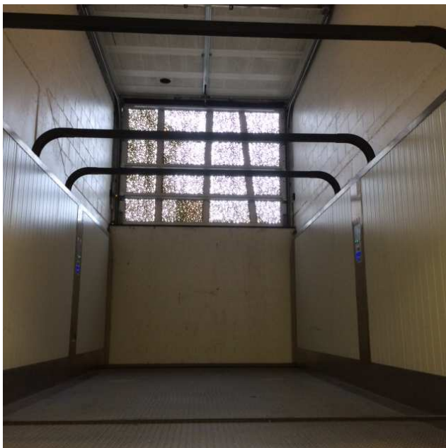
La cabine du monte-voiture

Dans le cas d'une défaillance technique ou de panne électrique, le chauffeur peut évacuer lui-même par tirer à une soupape de sécurité pour faire descendre le monte-voiture et et il peut ouvrir la porte du sous-sol manuellement.