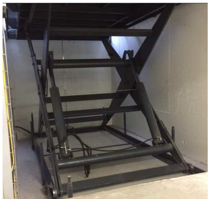
Système de ciseaux