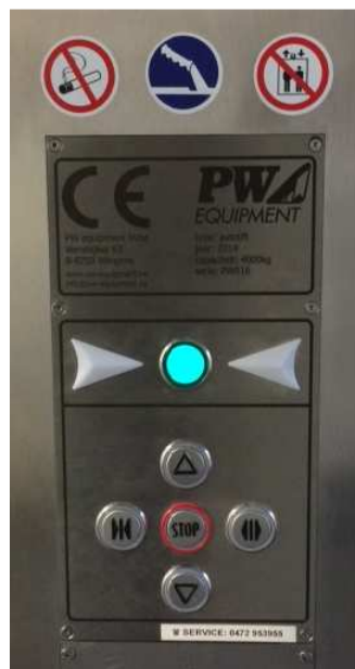
Panneau de commande