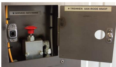
Evacuation avec une soupape de sécurité

Vous pouvez toujours contacter PW équipement pour un devis détaillé et un plan de mise en œuvre.